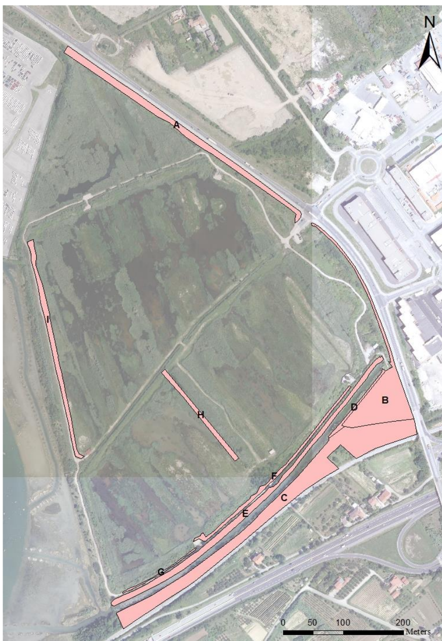
Slika 1: Grafični prikaz predvidenih ploskev odstranjevanja in preprečevanja razširjanja tujerodnih vrst rastlin

Redna pozna košnja na območju sladkovodnega močvirja poteka po končani gnezditvi ptic. Po končani košnji se zaradi ohranjanja in oblikovanja primernih habitatov odstrani biomasa ter organski material deponira na prostoru za odlaganje in kompostiranje rastlinskega materiala. Hkrati poteka tudi odstranjevanje vegetacije z brežin jarkov in mulčanje vegetacije na težko dostopnih predelih in vzdrževanje ograde z električnim pastirjem. Za razvoj oligotrofnih mokrotnih travnikov se izbrane površine izvzamejo iz paše in se dosejejo z gradniki tovrstnih habitatnih tipov. Strojnega čiščenja jarkov in popravil prehodov za pašne živali za leto 2019 ne načrtujemo, ker so bili ukrepi izvedeni v letu 2018.